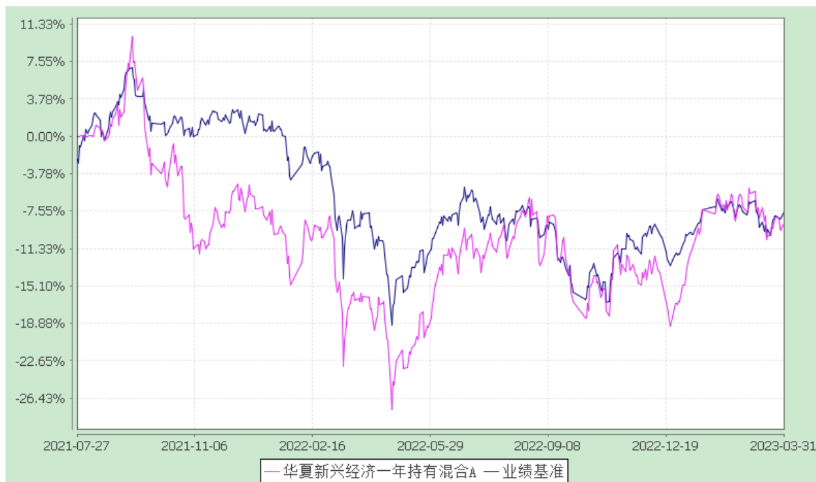
华夏新经济一年持有混合 C: