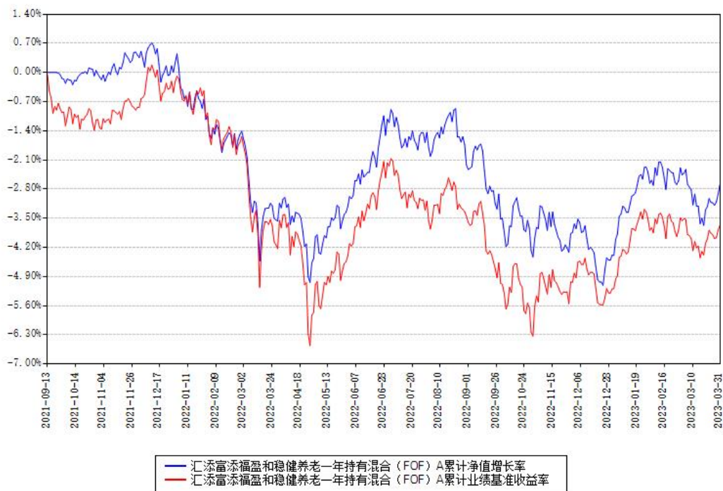
汇添富添福盈和稳健养老一年持有混合（FOF）Y 累计净值增长率与同期业绩基准收益率对比图