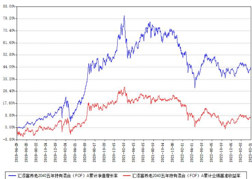
汇添富养老2040五年持有混合（FOF）A累计净值增长率与同期业绩比较基准收益率对比图