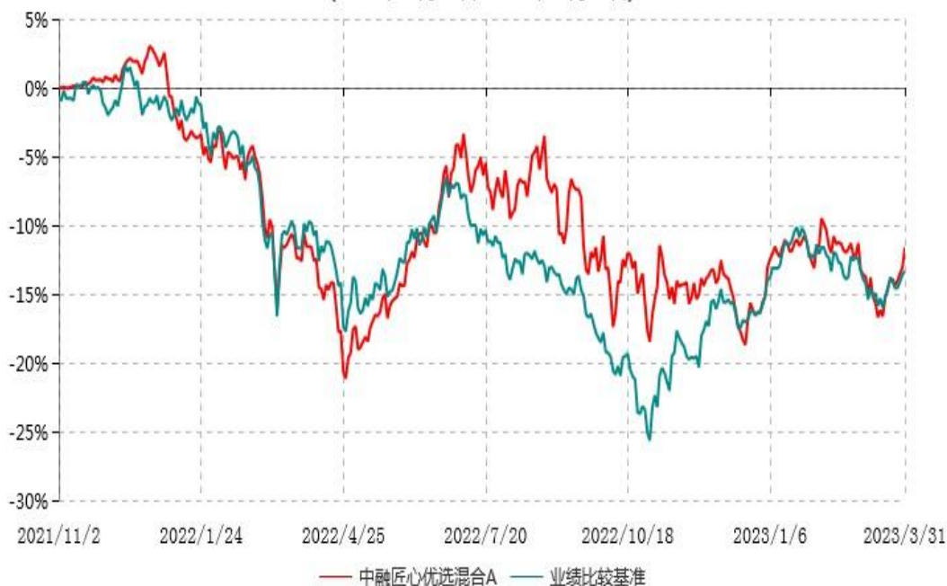
中融匠心优选混合A累计净值增长率与业绩比较基准收益率历史走势对比图 (2021年11月02日-2023年03月31日)