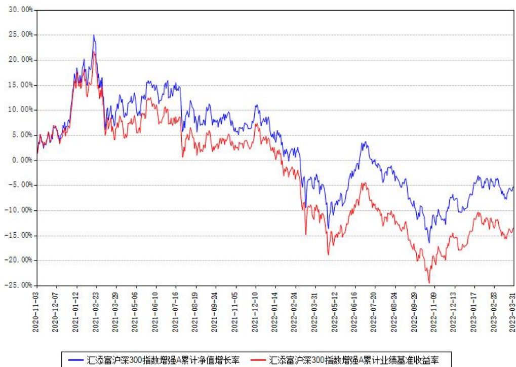
汇添富沪深300指数增强A累计净值增长率与同期业绩基准收益率对比图