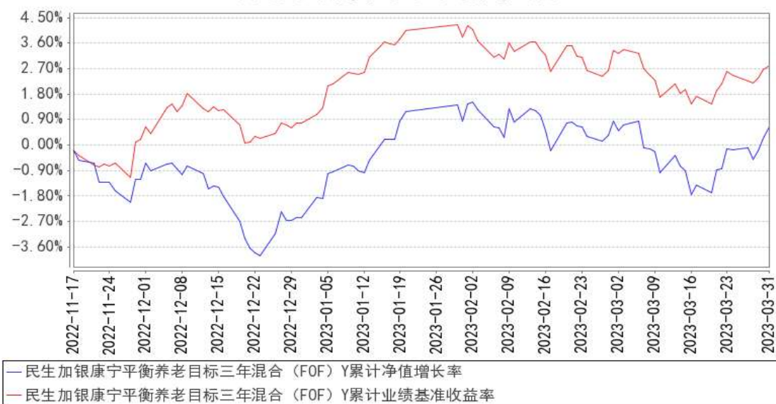
民生加银康宁平衡养老目标三年混合（FOF）Y 累计净值增长率与同期业绩比较基准收益率的历史走势对比图

注：本基金合同于 2020 年 9 月 9 日生效，本基金建仓期为自基金合同生效日起的 6 个月。截至建仓期结束，本基金各项资产配置比例符合基金合同及招募说明书有关投资比例的约定。本基金于 2022 年 11 月 17 日起增加 Y 类份额。