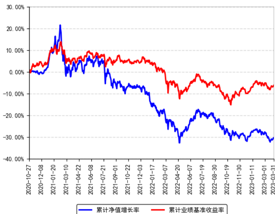
南方行业精选一年持有混合A累计净值增长率与同期业绩比较基准收益率的历史走势对比图