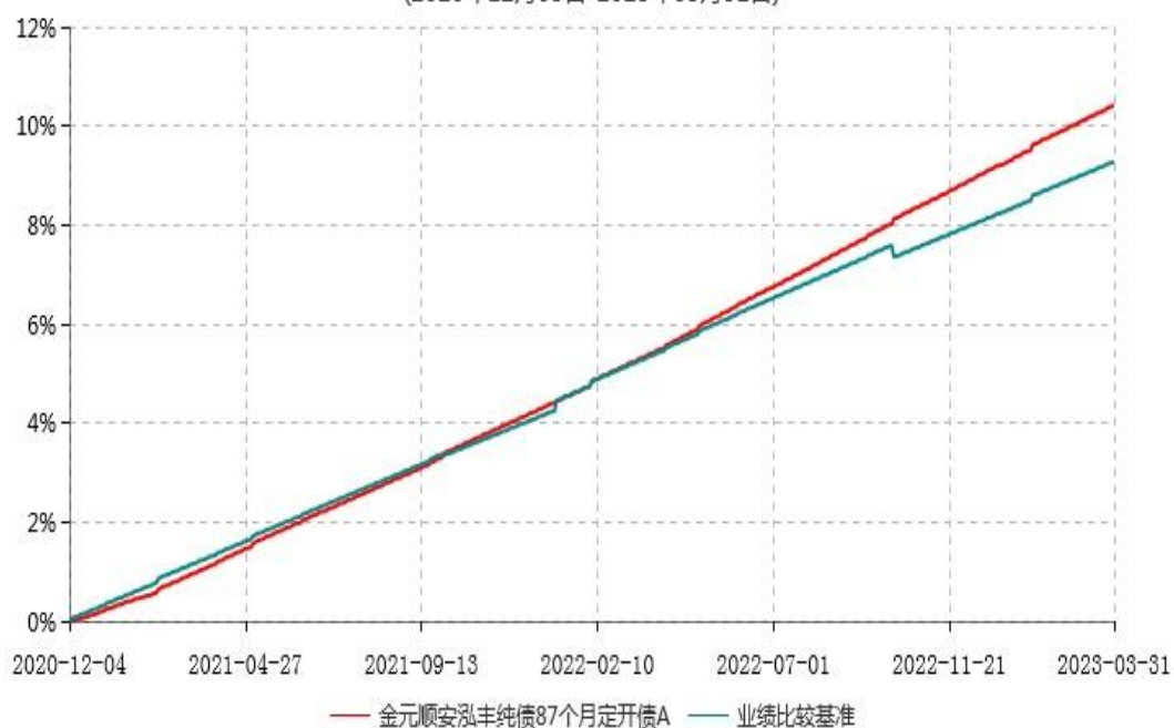
金元顺安泓丰纯债87个月定开债A累计净值增长率与业绩比较基准收益率历史走势对比图 (2020年12月03日-2023年03月31日)