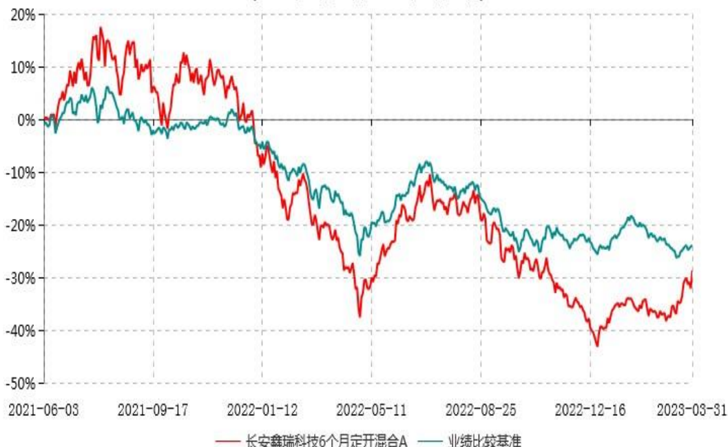
长安鑫瑞科技6个月定开混合A累计净值增长率与业绩比较基准收益率历史走势对比图 (2021年06月03日-2023年03月31日)

根据基金合同的规定,自基金合同生效之日起 6 个月内基金各项资产配置比例需符合基金合同要求。本基金在建仓期结束后,各项资产配置比例已符合基金合同有关投资比例的约定。基金合同生效日至报告期期末,本基金运作时间超过一年。图示日期为 2021 年 06 月 03 日至 2023 年 3 月 31 日。