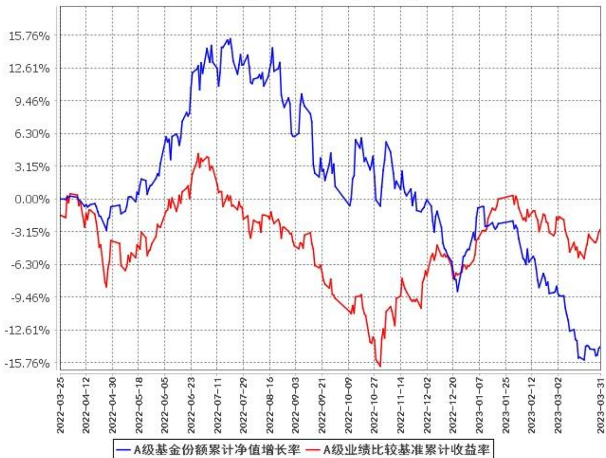
A级基金份额累计净值增长率与同期业绩比较基准收益率的历史走势对比图 (2022年3月25日至2023年3月31日)