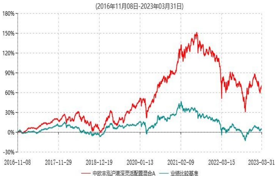
中欧丰泓沪港深灵活配置混合A累计净值增长率与业绩比较基准收益率历史走势对比图

注：2020 年 2 月 22 日起组合业绩比较基准由“沪深 300 指数收益率×60%+中债综合指数收益率×40%”变更为“沪深 300 指数收益率*35%+中证港股通综合指数收益率*55%+中证短债指数收益率*10%”。