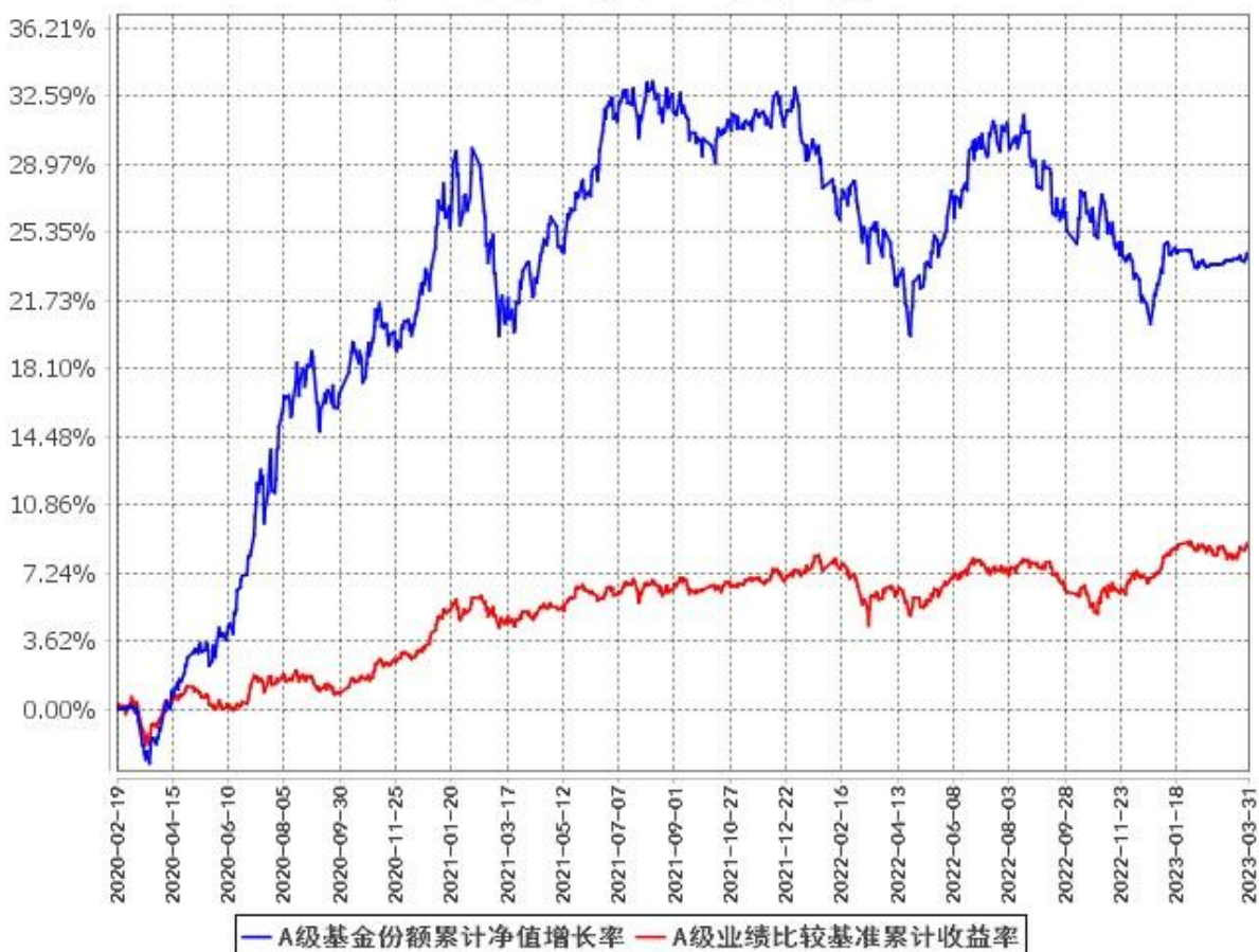
A级基金份额累计净值增长率与同期业绩比较基准收益率的历史走势对比图 (2020年2月19日至2023年3月31日)