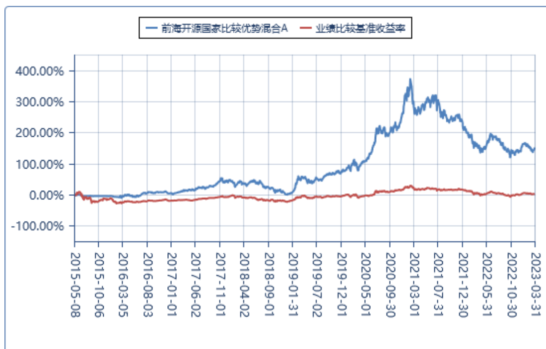
前海开源国家比较优势混合 C