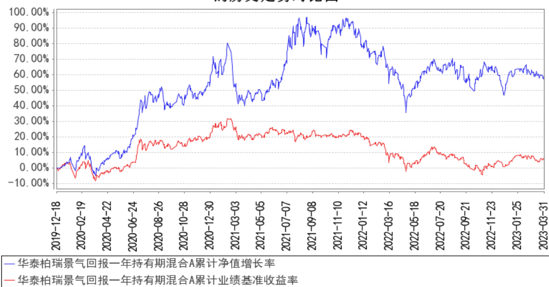
华泰柏瑞景气回报一年持有期混合A累计净值增长率与同期业绩比较基准收益率的历史走势对比图