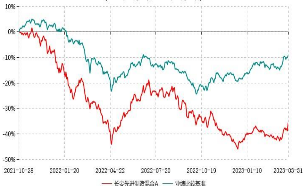
长安先进制造混合A累计净值增长率与业绩比较基准收益率历史走势对比图 (2021年10月28日-2023年03月31日)

根据基金合同的规定,自基金合同生效之日起 6 个月内基金各项资产配置比例需符合基金合同要求。本基金在建仓期结束后,各项资产配置比例已符合基金合同有关投资比例的约定。图示日期为 2021 年 10 月 28 日至 2023 年 3 月 31 日。