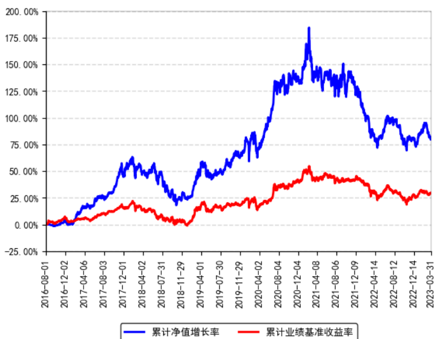
南方品质优选灵活配置混合A累计净值增长率与同期业绩比较基准收益率的历史走势对比图