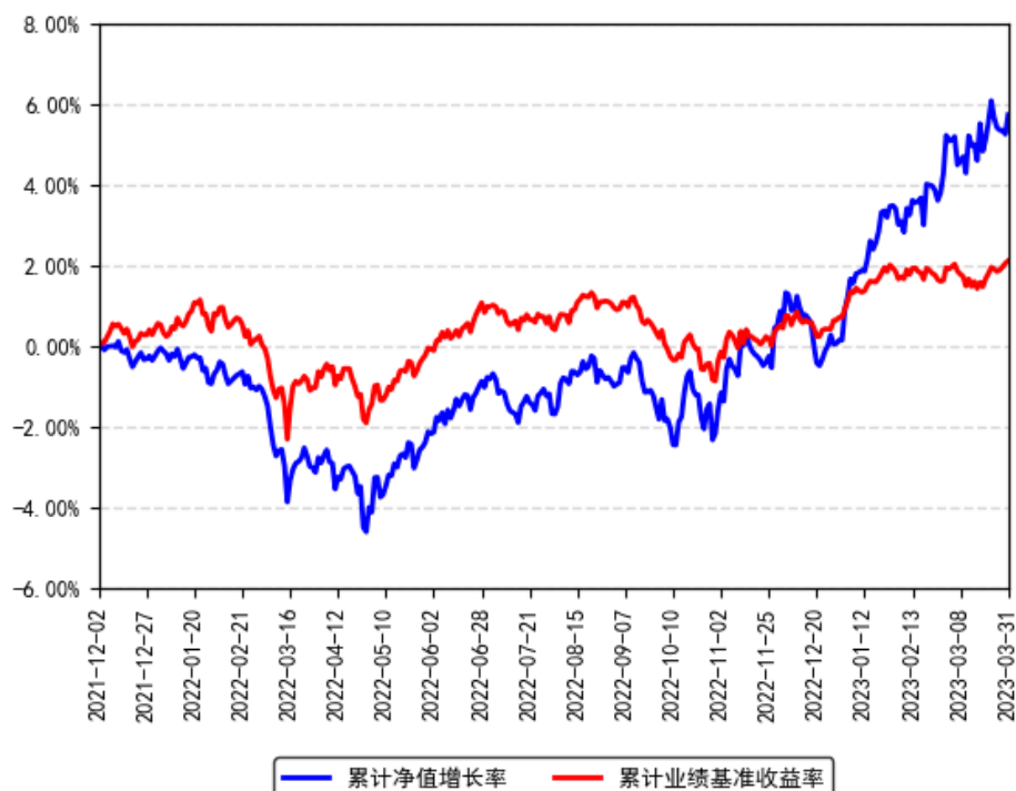
南方誉盈一年持有混合A累计净值增长率与同期业绩比较基准收益率的历史走势对比图