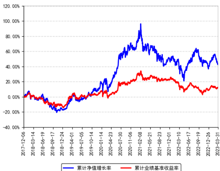
南方优享分红灵活配置混合A累计净值增长率与同期业绩比较基准收益率的历史走势对比图