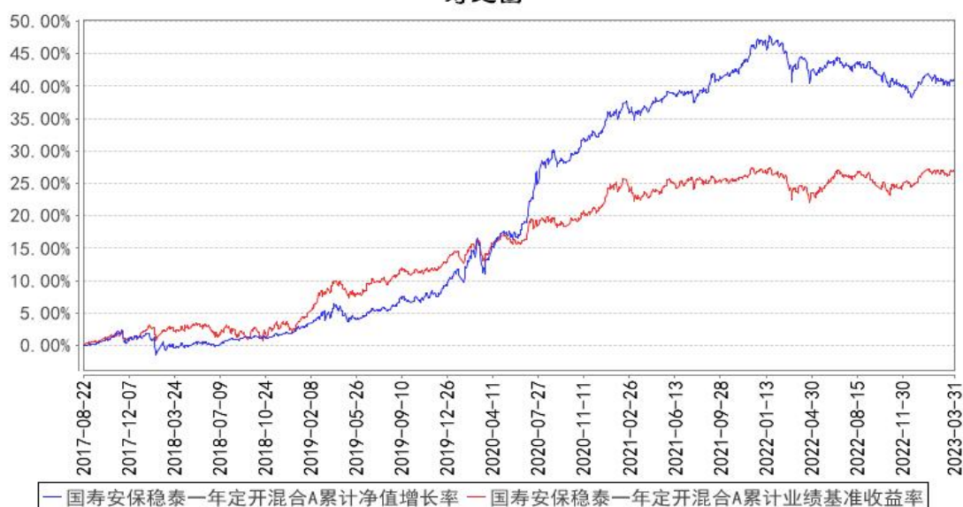
国寿安保稳泰一年定开混合A累计净值增长率与同期业绩比较基准收益率的历史走势对比图