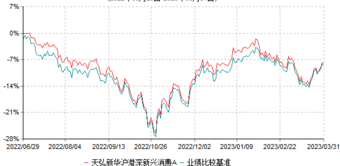
天弘新华沪港深新兴消费A累计净值增长率与业绩比较基准收益率历史走势对比图 (2022年06月29日-2023年03月31日)