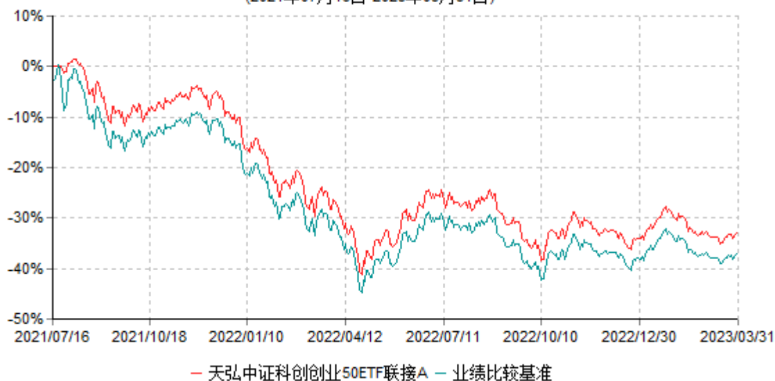
天弘中证科创创业50ETF联接A累计净值增长率与业绩比较基准收益率历史走势对比图 (2021年07月16日-2023年03月31日)