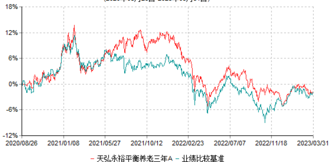
天弘永裕平衡养老三年A累计净值增长率与业绩比较基准收益率历史走势对比图 (2020年08月26日-2023年03月31日)