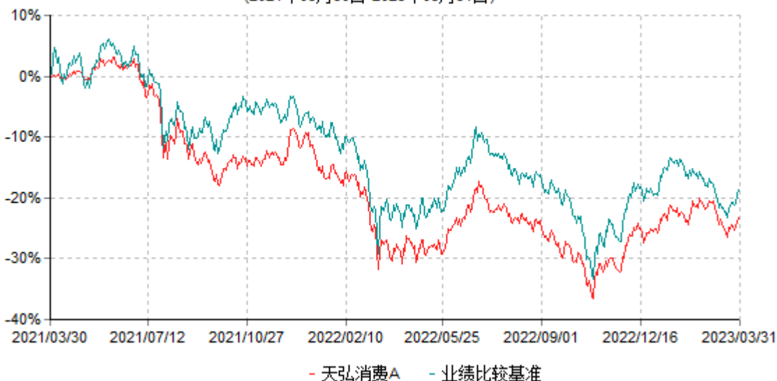
天弘消费A累计净值增长率与业绩比较基准收益率历史走势对比图 (2021年03月30日-2023年03月31日)