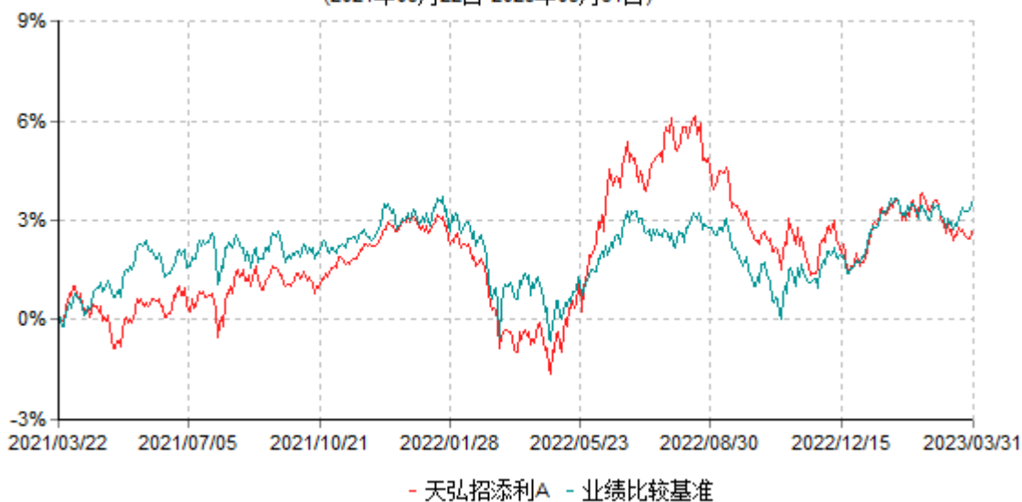
天弘招添利A累计净值增长率与业绩比较基准收益率历史走势对比图 (2021年03月22日-2023年03月31日)