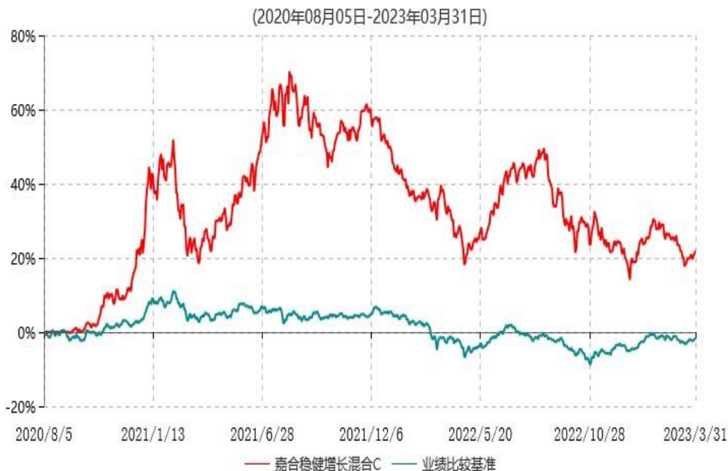
嘉合稳健增长混合C累计净值增长率与业绩比较基准收益率历史走势对比图