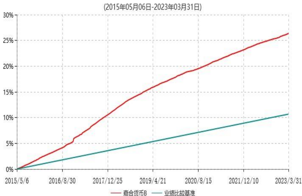
嘉合货币B累计净值收益率与业绩比较基准收益率历史走势对比图