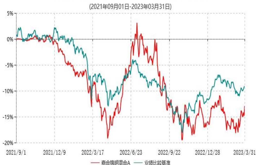
嘉合锦明混合A累计净值增长率与业绩比较基准收益率历史走势对比图