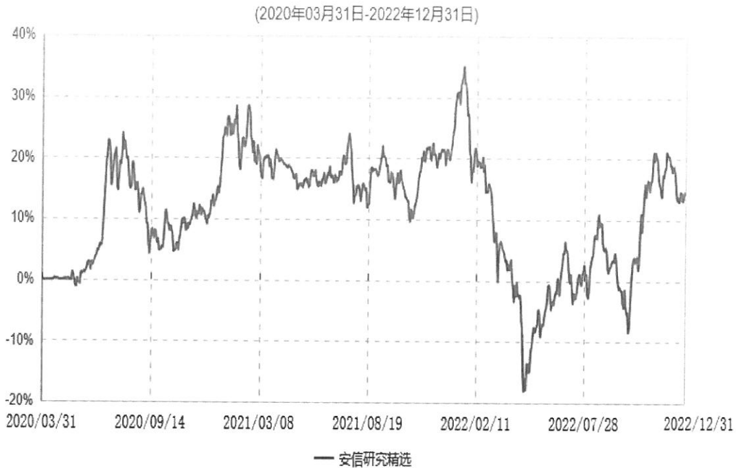
安信研究精选集合资产管理计划累计净值增长率走势图