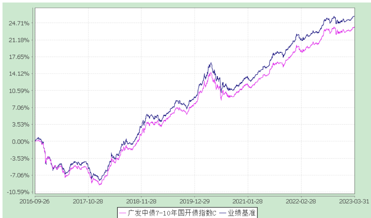
广发中债 7-10 年国开债指数 E: