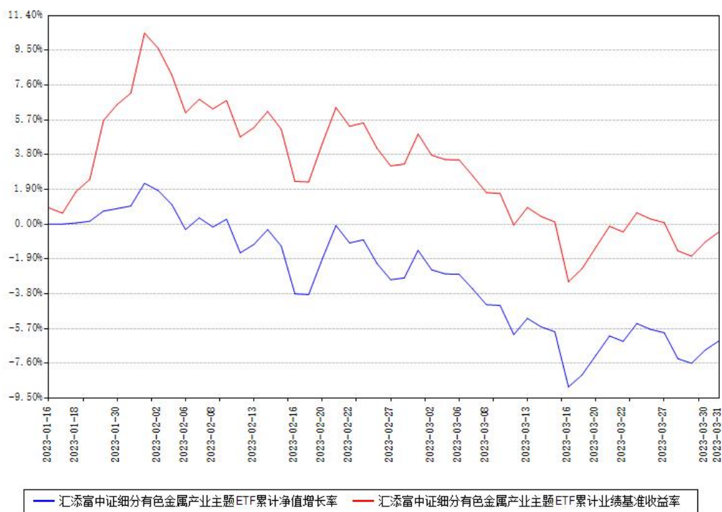
汇添富中证细分有色金属产业主题ETF累计净值增长率与同期业绩基准收益率对比图