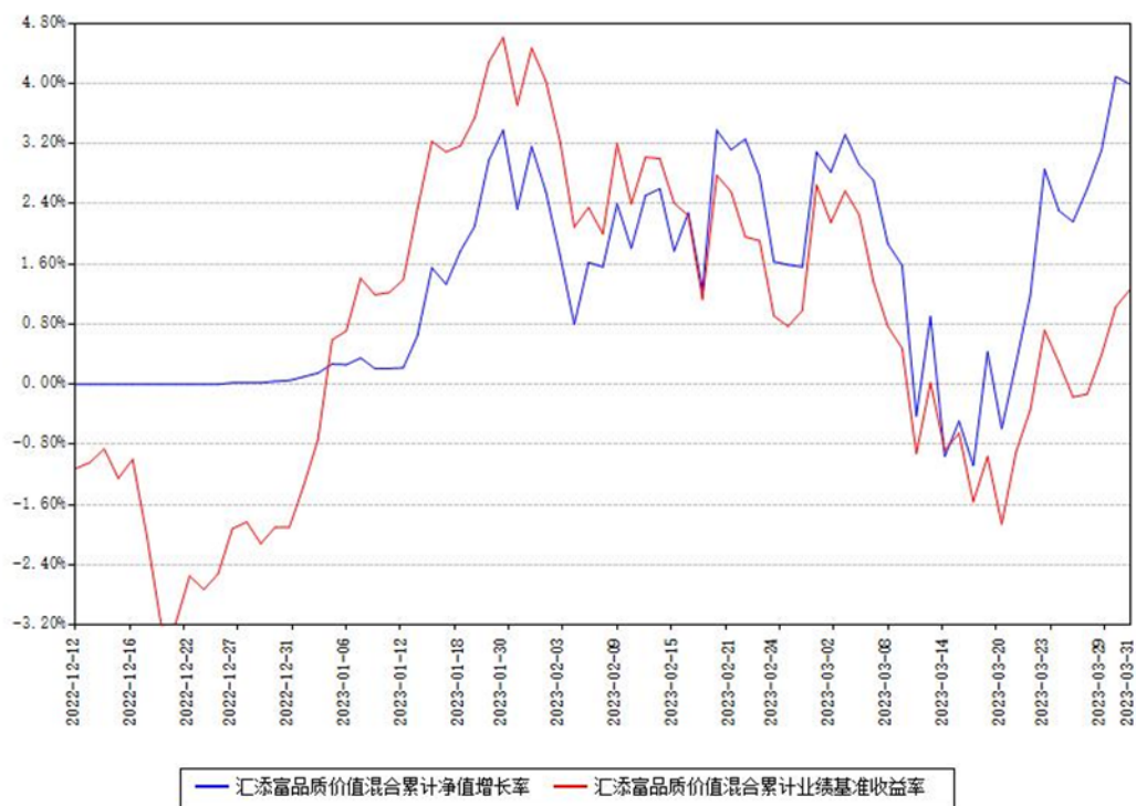
汇添富品质价值混合累计净值增长率与同期业绩基准收益率对比图