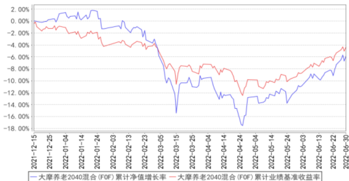
大摩养老2040混合(FOF)累计净值增长率与同期业绩比较基准收益率的历史走势对比图