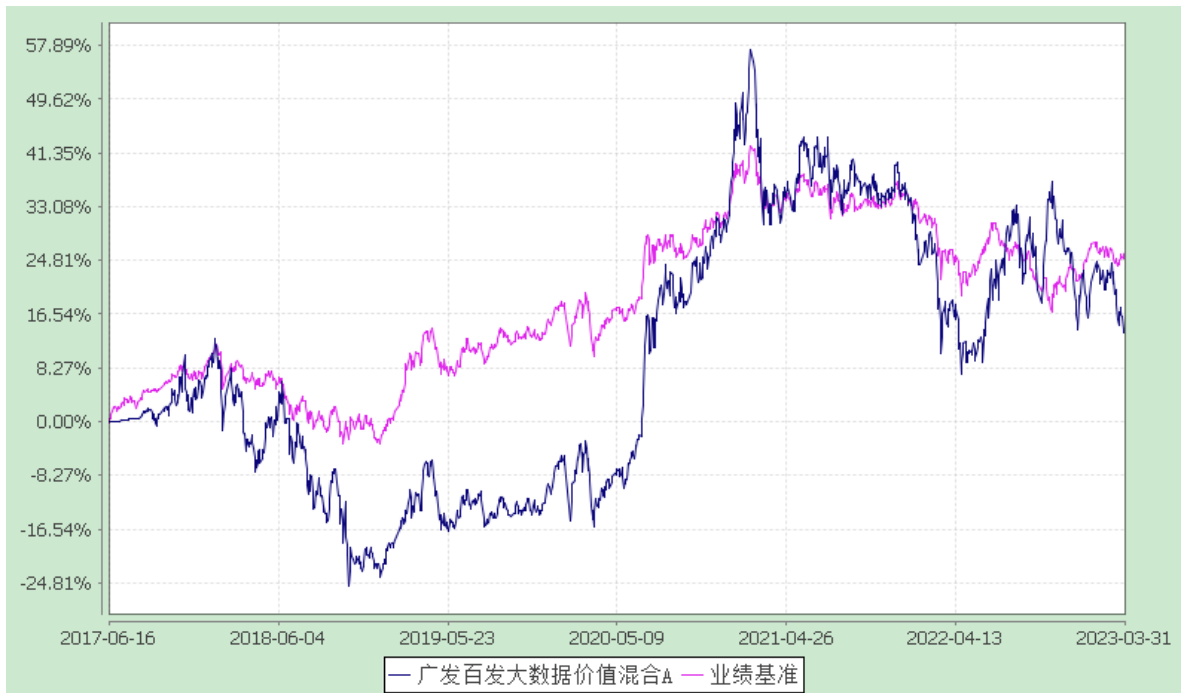
广发百发大数据价值混合 E