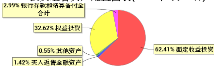
投资组合资产配置图表(2023年3月31日)

● 固定收益投资 ● 买入返售金融资产 ● 其他资产 ● 权益投资 ● 银行存款和结算备付金合计