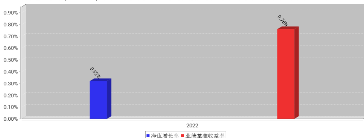
工银睿智进取股票(FOF-LOF)C基金每年净值增长率与同期业绩比较基准收益率的对比图（2022年12月31日）

注：1、《工银瑞信睿智进取一年封闭运作股票型基金中基金（FOF-LOF）基金合同》于2021年11月24日生效，工银瑞信睿智进取一年封闭运作股票型基金中基金（FOF-LOF）自2022年11月24日转型为工银瑞信睿智进取股票型基金中基金（FOF-LOF）。《工银瑞信睿智进取一年封闭运作股票型基金中基金（FOF-LOF）基金合同》生效当年不满完整自然年度的，按实际期限计算净值增长率。