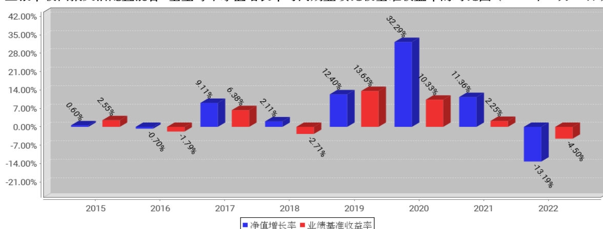
工银丰收回报灵活配置混合A基金每年净值增长率与同期业绩比较基准收益率的对比图（2022年12月31日）

注：1、本基金基金合同于 2015 年 10 月 27 日生效。合同生效当年不满完整自然年度的，按实际期限计算净值增长率。