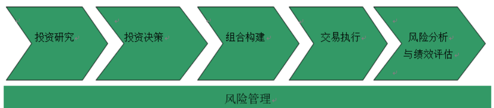
图 1 投资管理流程

本基金管理人建立了规范的投资管理流程和严格的风险管理体系，贯彻于投资研究、投资决策、组合构建、交易执行、风险管理及绩效评估的全过程。