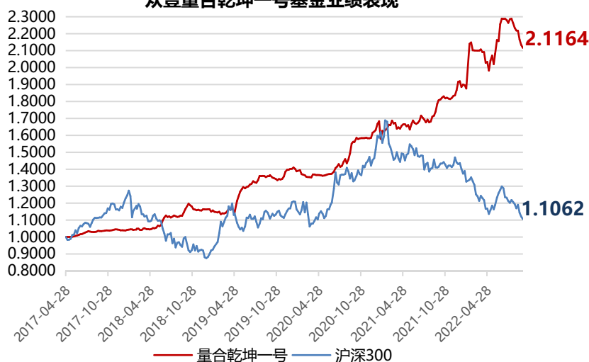
众壹量合乾坤一号基金业绩表现

注: 1、份额净值, 是每份基金单位的净资产价值, 等于基金的总资产减去总负债后的余额再除以基金全部发行的单位份额总数。 2、份额累计净值=份额净值+基金成立后累计份额分红金额。