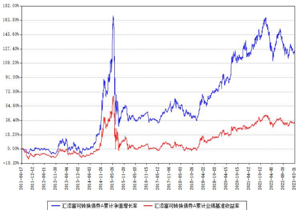
汇添富可转换债券A累计净值增长率与同期业绩基准收益率对比图