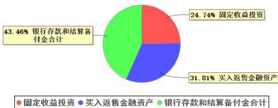
投资组合资产配置图表(2023年3月31日)