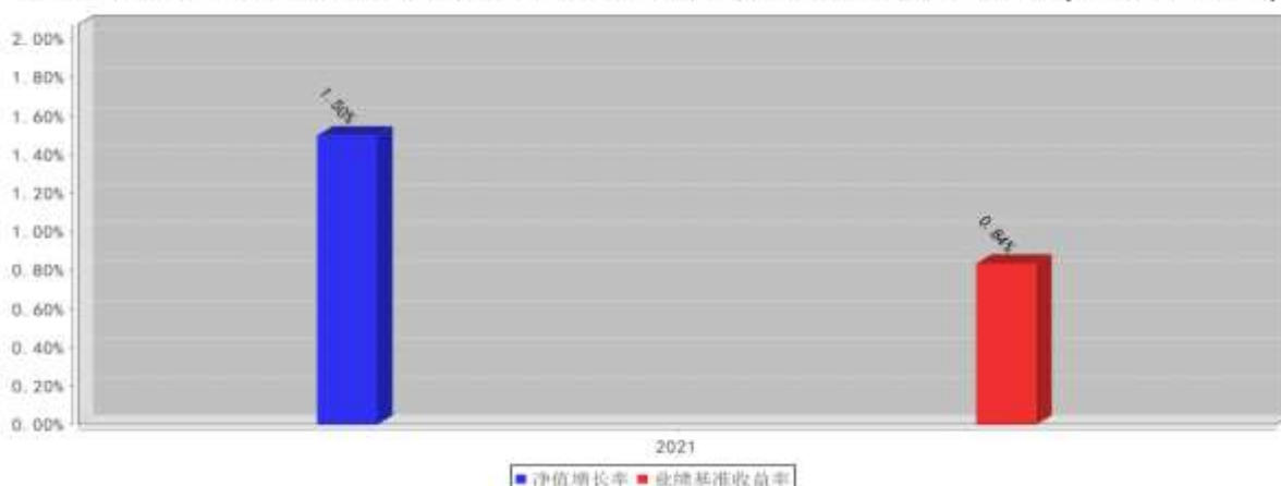
西部利得聚兴一年定开混合C基金每年净值增长率与同期业绩比较基准收益率的对比图(2021年12月31日)