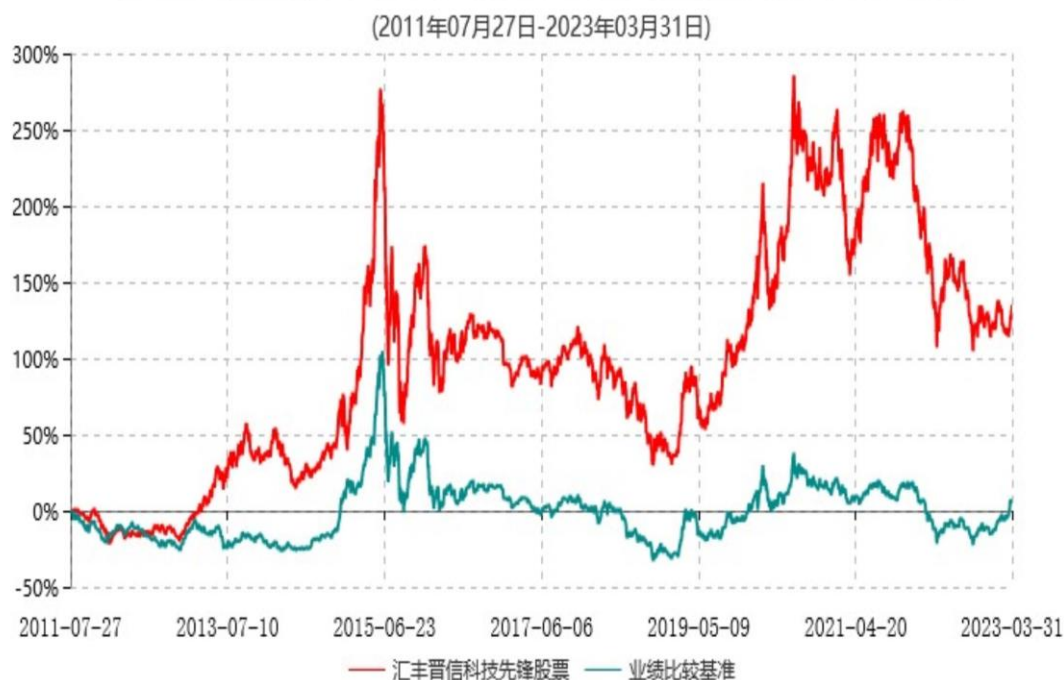
汇丰晋信科技先锋股票型证券投资基金累计净值增长率与业绩比较基准收益率历史走势对比图