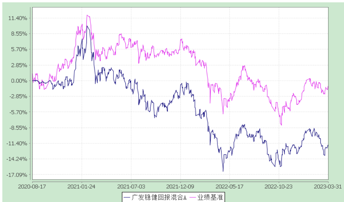
广发稳健回报混合 C: