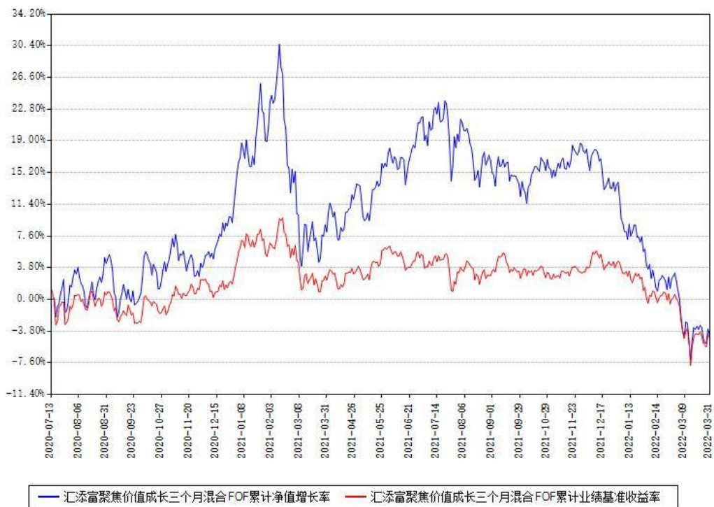
汇添富聚焦价值成长三个月混合FOF累计净值增长率与同期业绩基准收益率对比图