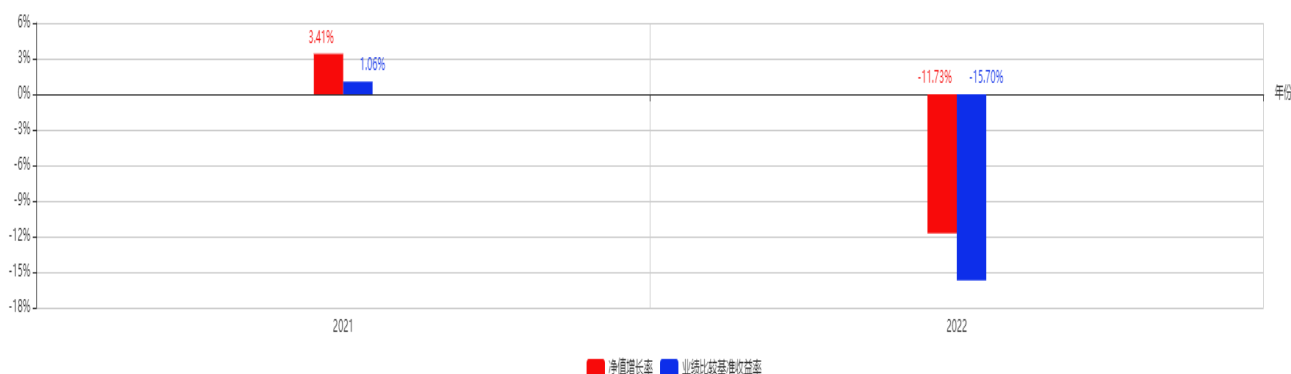
基金每年的净值增长率及与同期业绩比较基准的比较图