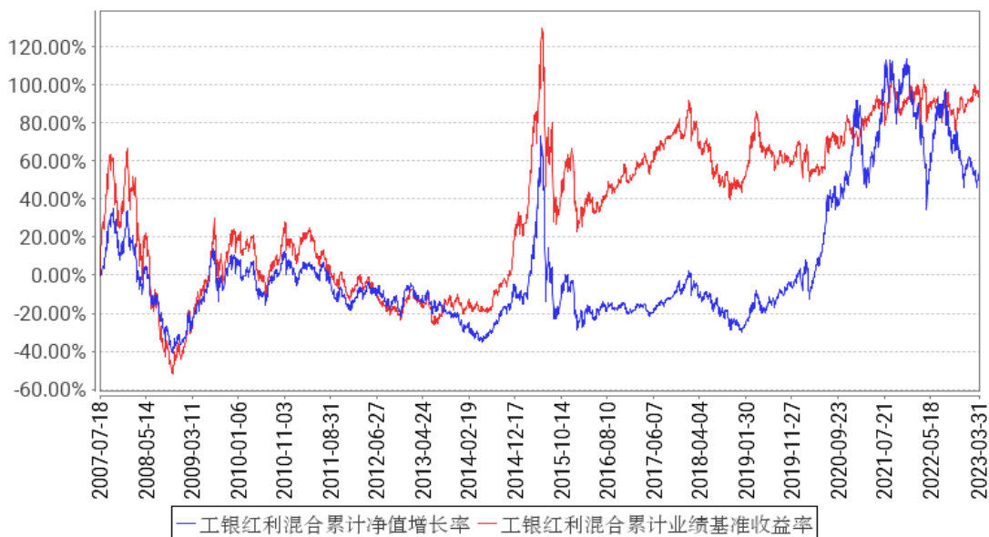
工银红利混合累计净值增长率与同期业绩比较基准收益率的历史走势对比图