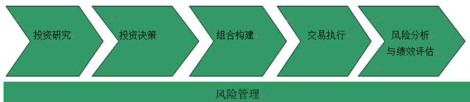
图 1 投资管理流程

本基金管理人建立了规范的投资管理流程和严格的风险管理体系，贯彻于投资研究、投资决策、组合构建、交易执行、风险管理及绩效评估的全过程。