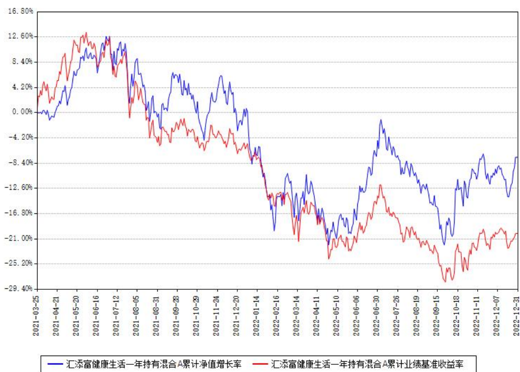
汇添富健康生活一年持有混合A累计净值增长率与同期业绩基准收益率对比图