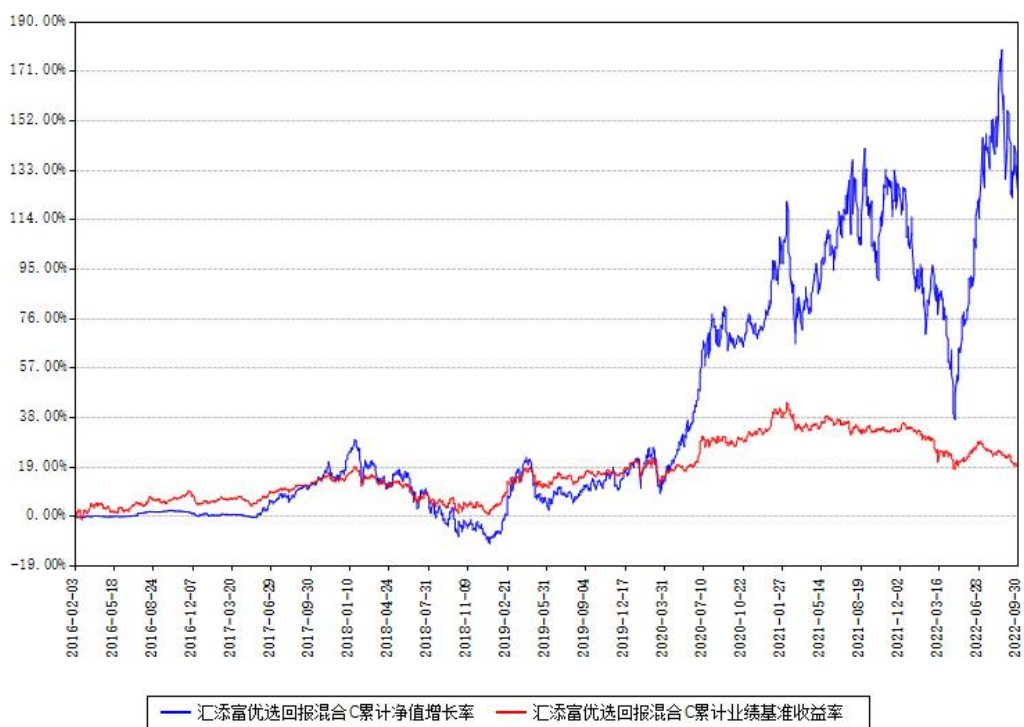
汇添富优选回报混合C累计净值增长率与同期业绩基准收益率对比图