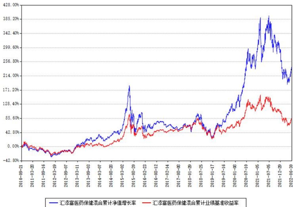
汇添富医药保健混合累计净值增长率与同期业绩基准收益率对比图